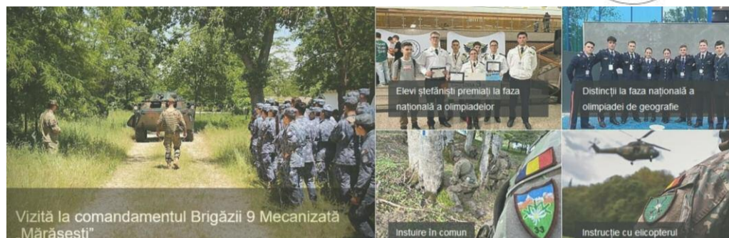
Vizită la comandamentul Brigăzii 9 Mecanizată „Mărăsești”

Publicație editată de Divizia 2 Infanterie „Getica” Bulevardul Mareșal Alexandru Averescu nr. 1, Buzău www.armata-buzau.ro